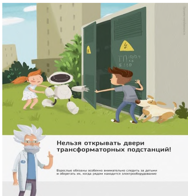
Рис.1 Нельзя открывать двери трансформаторных подстанций

Ежегодно энергетики проводят для школьников познавательные уроки, конкурсы рисунков и историй на тему электричества и правильного с ним обращения. Но работы одних энергетиков в данном направлении недостаточно, для полного понимания проблем электробезопасности нужен пример общества, в котором растет ребенок, и, конечно же, главным образом родителей. Эта работа приносит свои результаты: электротравмы на энергетических объектах единичные, и каждый случай становится поводом для служебной проверки. Но только технических мер мало для того, чтобы полностью обезопасить детей. Им нужен пример родителей.